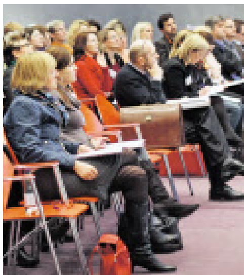
Gebannte Zuhörer beim Vortrag im SN-Saal.

Der Human Resources Business Club lud Interessenten am vergangenen Dienstag in den Saal der „Salzburger Nachrichten“ zum Tagesseminar „Arbeitsrechtliche Neuerungen“.